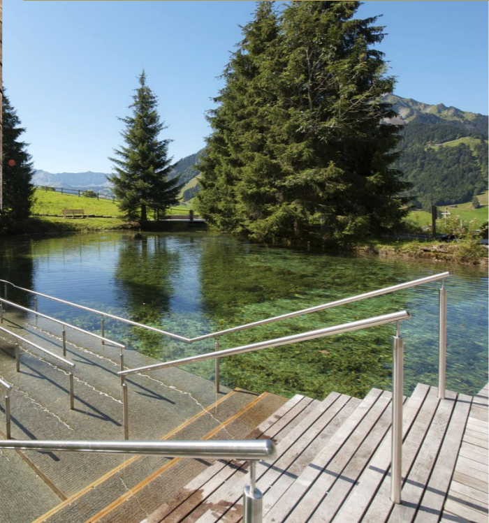
Die Treppe ins kalte Wasser

„ «Viele Erinnerungen aus der Schulzeit verblassen mit den Jahren – die Erlebnisse aus den Lagerwochen hingegen überdauern.»